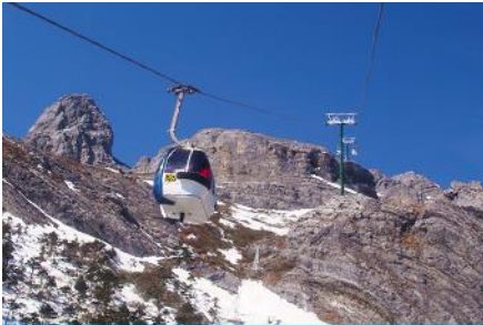
ภูเขาหิมะมังกรหยก (นั่งกระเช้าใหญ่)

ที่พัก FENG HUANG HOTEL ระดับ 4 ดาว หรือเทียบเท่าเมืองลี่เจียง