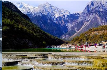
หุบเขาพระจันทร์สีน้ำเงิน "ป๋อสูยเหอ"

วันที่สี่ ภูเขาหิมะมังกรหยก (รวมนั่งกระเช้าใหญ่ขึ้นลง)– หุบเขาพระจันทร์สีน้ำเงิน-น้ำตกป๋อสูยเหอ ออฟชั่น ไกด์ขายรถกอล์ฟ ท่านละ 80 หยวน โชว์ IMPRESSION LIJIANG- อุทยานน้ำหยก -ต้าหลี่