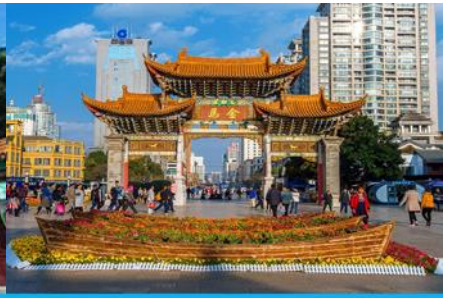
ซุ้มประตูโบราณ ม้าทอง ไถ่หยก

วันที่หก คุนหมิง - KUNMING WATERFALL PARK – ตำหนักทองจีนเตี้ยน - ซุ้มประตูโบราณ ม้าทอง ไถ่หยก - ร้าน POP MART (ตามหาลาบูนู้) - กรุงเทพฯ (สุวรรณภูมิ)