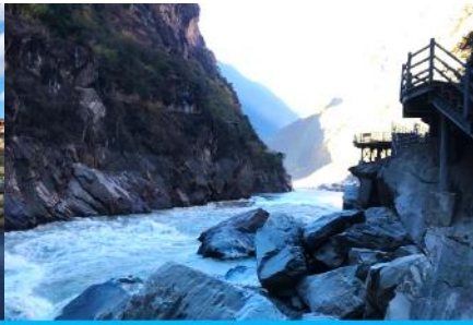
ช่องแคบเสือกระโจน