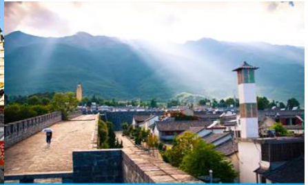
หมู่บ้านซีโจว(หมู่บ้านชาวไป๋)