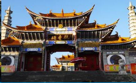
วัดเจ้าแม่กวนอิมเปลงกาย