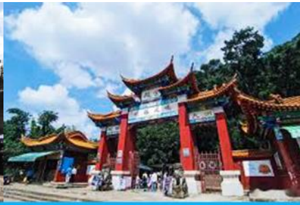
ตำหนักทองจีนเตี้ยน