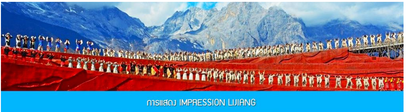
การแสดง IMPRESSION LIJIANG

หลังอาหารนำท่านชมการแสดง IMPRESSION LIJIANG โชว์อันยิ่งใหญ่โดยผู้กำกับชื่อก้องโลก “จาง อวี๋โหมว” ได้เนรมิต ให้ภูเขาหิมะมังกรหยกเป็นฉากหลัง และบริเวณทุ่งหญ้าเป็นเวทีการแสดง โดยใช้นักแสดงกว่า 600 ชีวิต แสง สี เสียง การแต่งกายตระการตาเล่าเรื่องราวชีวิตความเป็นอยู่ และชาวเผ่าต่างๆ ของเมืองลี่เจียง