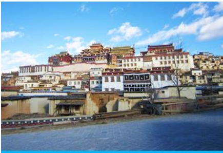
วัดลามะชวงจ้านหลิง