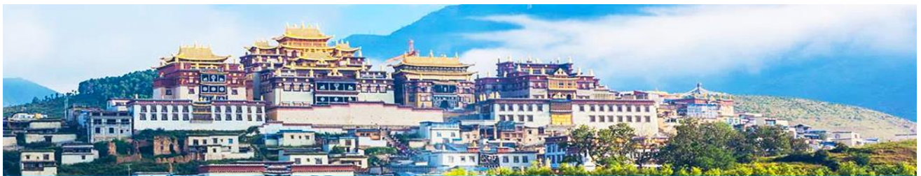
เมืองโบราณเซงกรี่ล่า

จากนั้นนำท่านชม หมู่บ้านซีโจวหรือหมู่บ้านชาวไป๋ ชนพื้นเมืองที่สำคัญของเมือง ชมการแสดงของชนชาติไป๋พร้อมชิมชาสามแก้ว เพื่อรำลึกถึงวิถีชีวิตและการเกิดมาเป็นมนุษย์ของตนเอง ซึ่งถือเป็นเอกลักษณ์ของชนชาวไป๋ ที่หาดูได้ยาก