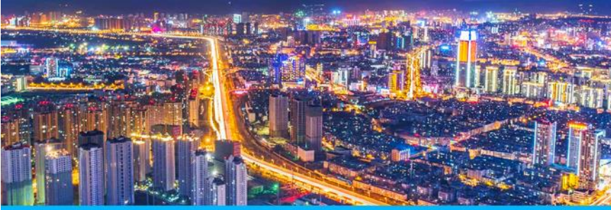
นครคุนหมิง