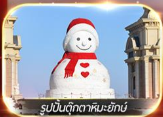
หมู่บ้านตุ๊กตาหิมะยักษ์