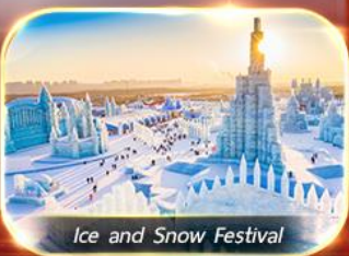
Ice and Snow Festival