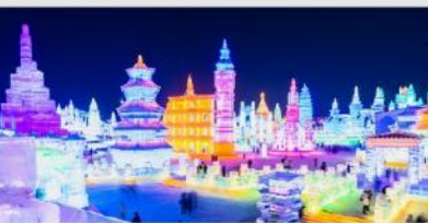
เทศกาลโคมไฟน้ำแข็ง