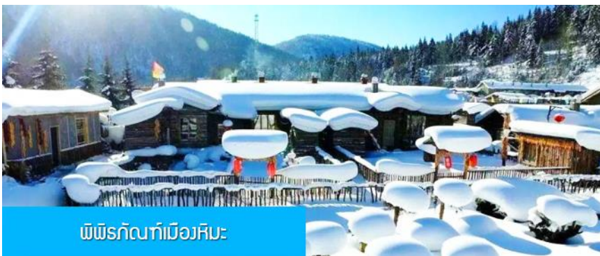
พิพิธภัณฑ์เมืองหิมะ

หมายเหตุ 2 ห้องพักในหมู่บ้านหิมะเป็นโฮมสเตย์ขนาดเล็ก เครื่องอำนวยความสะดวกและบริการอาหารมีค่าและมือเช้าจะไม่ตัดเทียบกับโรงแรมในเมือง และมีอาหารในภัตตาคารได้ ท่านควรเตรียมผ้าเช็ดตัวแปรงสีฟัน ยาสีฟัน และเครื่องใช้ส่วนตัวที่จำเป็นนำติดตัวไปด้วย