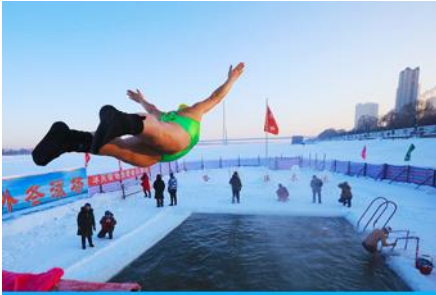
ชมการแสดงว่ายน้ำในฤดูหนาว