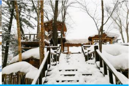
ระเบียงชมวิวยิวบ้านหิมะ

วันที่ห้า เมืองตุนฮว่า-ผ่านชมองค์พระใหญ่จีนตั้ง –เดินทางสู่หมู่บ้านหิมะ – ระเบียงชมวิวยิวบ้านหิมะ ถนน XUE YUN DAJIE