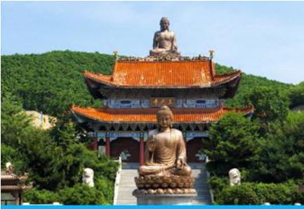
องค์พระพุทธรูปใหญ่จีนตัว