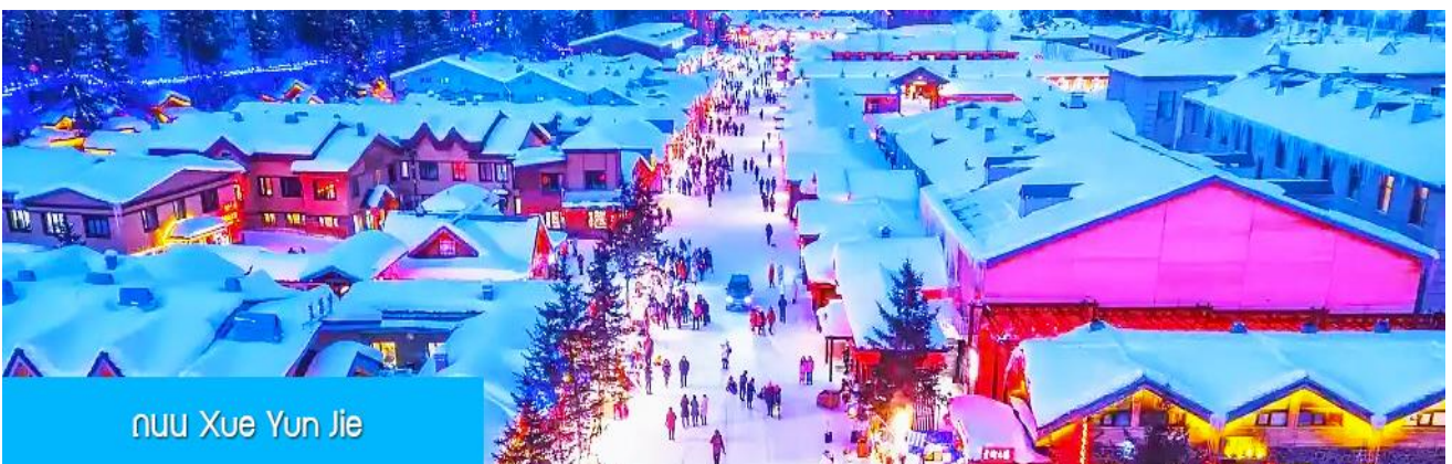
ถนน Xue Yun Jie