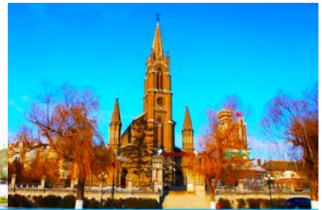
โบสถ์คอกอทลิก