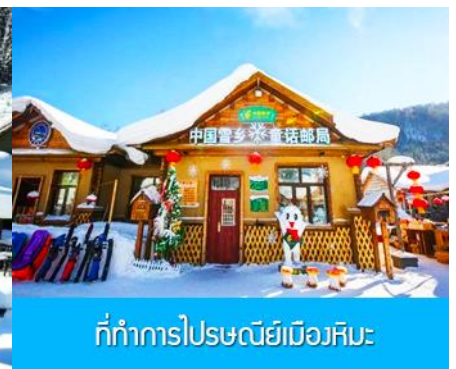
ที่ทำการไปรษณีย์เมืองหิมะ

วันที่หก พิพิธภัณฑหมู่บ้านหิมะ-ที่ทำการไปรษณีย์หมู่บ้านหิมะ-เลือกซื้อโปรแกรมเสริมระเบียบภาพหิมะสีบลู –เลือกซื้อโปรแกรมเสริม Snow Mobile Riding – เมืองฮาร์บิน