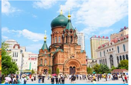
โบสถ์โซเฟีย