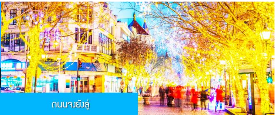
ถนนจงหยาง