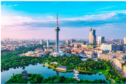
เมืองจีหลิน

23.30 น. คณะพร้อมกัน ณ ท่าอากาศยานสุวรรณภูมิ อาคารผู้โดยสารระหว่างประเทศขาออกอาคาร ชั้น 4 ประตู 10 เคาน์เตอร์สายการบิน SHENZHEN AIRLINES พบเจ้าหน้าที่บริษัทฯ คอยให้การต้อนรับและอำนวยความสะดวกด้านเอกสารและสัมภาระก่อนการเดินทาง