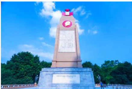
อนุสาวรีย์ฝ่งหง

เช้า รับประทานอาหารเช้า ณ ห้องอาหารของโรงแรม หลังอาหารนำท่าน ชมการแสดงว่ายน้ำในแม่น้ำขงฮัวเจียง 冬泳表演 ของชนพื้นเมือง ท่ามกลางสภาพอากาศหนาวเย็นด้วยอุณหภูมิตดลบ 20 องศา.....นำท่านชม โบสถ์โซเฟีย 索菲亚教堂 (ชมด้านนอก) อีกหนึ่งสัญลักษณ์ที่โดดเด่นของเมืองฮาร์บิน สร้างขึ้นในปี ค.ศ. 1907 เป็นโบสถ์คริสต์นิกายออร์ทอดอกซ์ที่ใหญ่ที่สุดในเอเชียตะวันออกเฉียงใต้ที่แสดงถึงอิทธิพลของวัฒนธรรมรัสเซียที่มีต่อเมืองฮาร์บิน..... ชมและถ่ายภาพกับ รูปปั้นตุ๊กตาหิมะยักษ์ 网红大雪人 เป็นตุ๊กตาหิมะขนาดใหญ่ความสูง 18 เมตร ที่ทางเทศบาลเมืองฮาร์บินจัดทำขึ้นในช่วงฤดูหนาวของทุกปี เช่นเดียวกับการประดับต้นคริสต์มาสในช่วงเทศกาลของชาวตะวันตก จนกลายเป็นสัญลักษณ์แห่งฤดูหนาวของเมืองฮาร์บิน