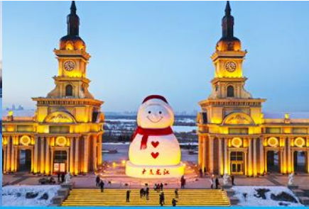
ตุ๊กตาหิมะยักษ์