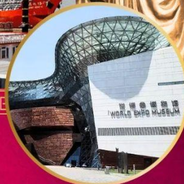
SHA WORLD EXPO MUSEUM