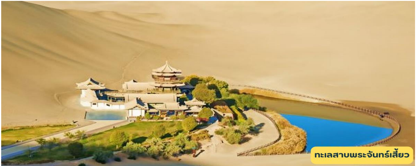
ทะเลสาบพระจันทร์เสี้ยว

เช้า ๑๐) รับประทานอาหารเช้า ณ ห้องอาหารโรงแรม