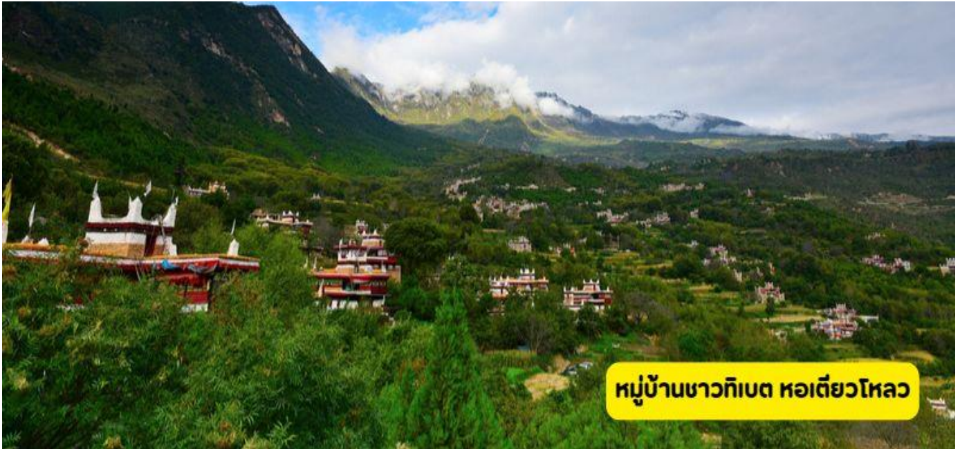
หมู่บ้านชาวทิเบต หอเตี้ยวโหลว