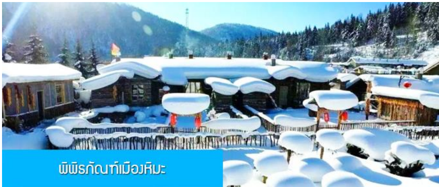
พิพิธภัณฑ์เมืองหิมะ

หมายเหตุ การไปพักในเมืองหิมะทางทิวรถไม่สามารถจอดทิวรถไปส่งลูกทิวรถถึงหน้าโฮมสเตย์ได้ ทางคณะต้องนั่งรถเมล์หมู่บ้านเข้าไป โดยลูกทิวรถต้องถือหรือลากกระเป๋าเข้าที่พักด้วยตัวเอง เพราะโฮมสเตย์จะไม่มีพนักงานยกกระเป๋ามาคอยบริการยกกระเป๋าให้ผู้เข้าพัก ท่านควรจัดเตรียมกระเป๋าใบเล็กที่บรรจุเสื้อผ้า และเครื่องใช้จำเป็นสำหรับการพักผ่อน ณ โฮมสเตย์ในเมืองหิมะในคืนนี้ เพื่อสะดวกต่อการเคลื่อนย้ายกระเป๋า, และภายในห้องพักจะไม่มีผ้าเช็ดตัวผืนใหญ่ จะมีเพียงสบู่ แชมพูบริการทุกโรงแรม ท่านควรเตรียมแปรงสีฟันยาสีฟันติดไปด้วย