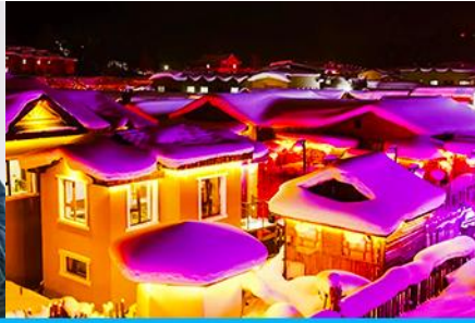
เมืองหิมะ Xue xiang