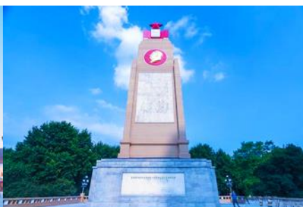
อนุสาวรีย์พิงหว