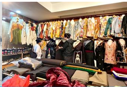
ศูนย์จำหน่ายอุปกรณ์กันหนาว