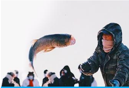
การจับปลาในฤดูหนาว

นำท่านชม การจับปลาในฤดูหนาว 冬捕 เป็นวิธีการจับปลาตามแม่น้ำและแหล่งน้ำในฤดูหนาวที่สืบทอดกันมายาวนาน โดยชาวบ้านจะนำแหดักปลามาวางดักไว้ตามจุดต่าง ๆ ก่อนที่ผิวน้ำจะปกคลุมด้วยน้ำแข็ง หลังจากผิวน้ำกลายเป็นน้ำแข็งแล้วชาวบ้านจะเจาะพื้นน้ำแข็งบริเวณที่มาแหวางดักอยู่เพื่อยกแหขึ้น จะมีปลาติดแหเป็นจำนวนมาก...พิเศษ ให้ท่านได้ชมการยกแหดักปลาจากสถานที่จริง และให้ท่านได้ชิมซูชิเนื้อปลาสด ๆ ที่ได้จากแหดักปลา