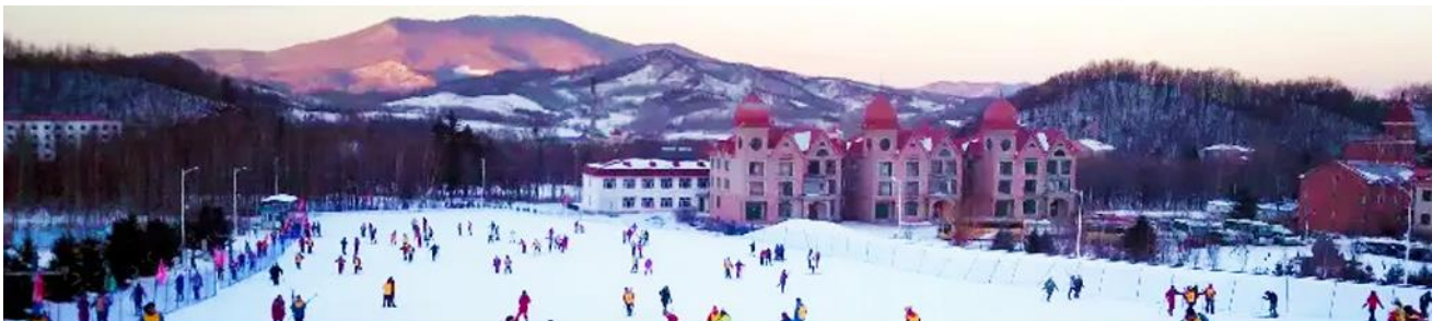
ลานสกียาบูลี