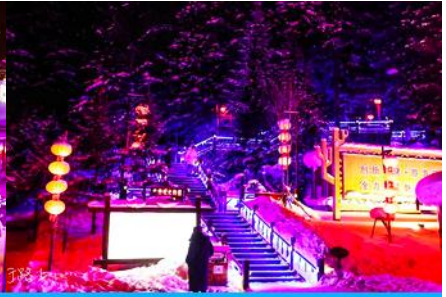
ระเบียงชมวิว บังดูยซาน