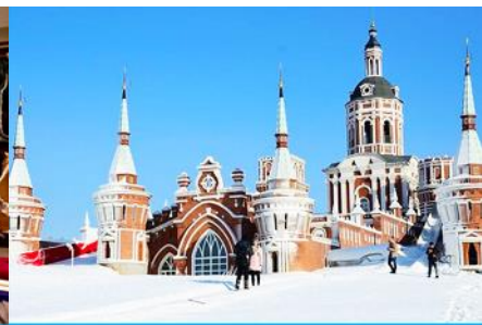
สวน LITTLE RUSSIA