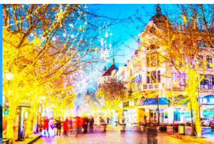
ถนนมายี่ลู่

วันที่ห้า เมืองฮาร์บิน-โบสถ์โซเฟีย-อนุสาวรีย์ป้องกันอุกกาภัก-ถนนจงยาลู่-นั่งรถไฟความเร็วสูงกลับเมืองต้าเหลียน-จัตุรัสซิงไห่-ถนนรัสเซีย