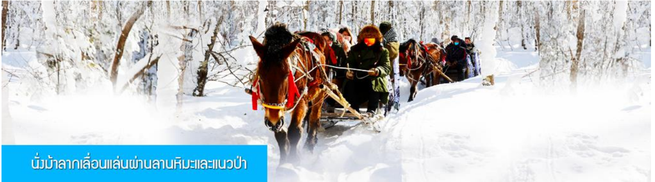
นั่งม้าลากเลื่อนผ่านลานหิมะและแนวป่า

รายการที่ 1 ระเบียบเดินชมวิว ภาพเขียนสิบสี่ 冰雪十里画廊 เป็นการเดินชมวิวธรรมชาติตามเนินเขา ท่ามกลางแนวป่าที่มีต้นไม้ที่มีน้ำแข็งเกาะอยู่ตามกิ่งไม้ เป็นภาพวิวธรรมชาติดูหนาวที่สวยงามน่าประทับใจและพบได้เฉพาะในฤดูหนาวทางภาคอีสานของจีนเท่านั้น เวลาที่ใช้สำหรับโปรแกรมเสริมนี้ประมาณ 1 ชั่วโมง อัตราค่าบริการ ท่านละ 220 หยวน หรือ 1100 บาท อัตรานี้รวมค่าบริการผ่านเข้าอุทยาน ค่ารถรับ ส่ง และค่าบริการของไกด์ท้องถิ่น และค่าบริการจัดการของบริษัททัวร์ท้องถิ่น.....หมายเหตุ โปรแกรมเสริมเป็นโปรแกรมที่ท่านต้องเสียค่าใช้จ่ายเองด้วยความสมัครใจ สำหรับท่านที่ไม่เข้าร่วมกิจกรรมดังกล่าวสามารถนั่งพักในรถได้