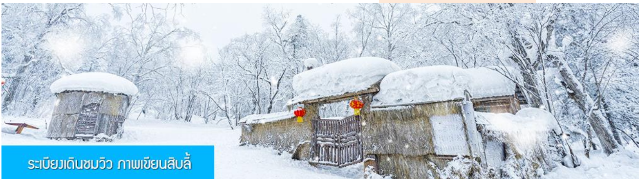
ระเบียบเดินชมวิว ภาพเขียนสีปลิว

เที่ยง รับประทานอาหารกลางวัน ณ ภัตตาคาร หลังอาหารนำท่านเดินทางกลับเมืองฮาร์บิน (ใช้เวลาเดินทางโดยรถบัสราว 5 ชั่วโมง) ระหว่างทางไกด์ท้องถิ่นจะเสนอขายโปรแกรมเสริมที่ไม่ได้รวมในค่าทัวร์ (ออฟชั่นแนล ทัวร์) 2 รายการ