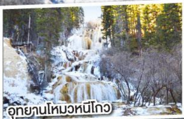
อุทยานโหมวหนี่โกว