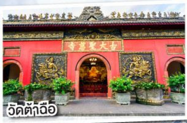
วัดต้าอื่อ