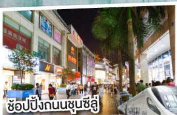
ช้อปปิ้งถนนชุนชู่