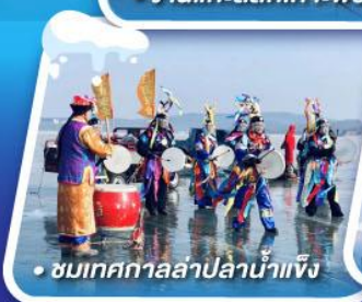
• ชมเทศกาลลampionน้ำแข็ง