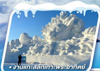
• งานแกะสลักเกาะพระอาทิตย์