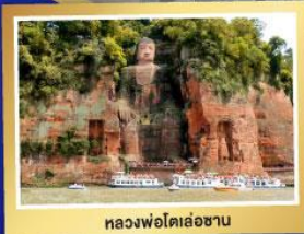
หลวงฟงโตเล่อซาน