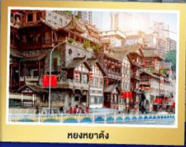
หยงหยาดัง