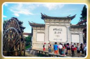
เมืองก่าลี่เจียง