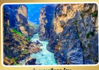
ช่องแคบเสียนเถาะ