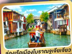
ล่องเรือเมืองโบราณซูโจวเจียเจียว