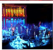
โรงละคร ONLY HENAN