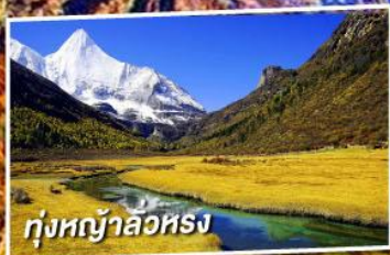
ทุ่งหญ้าลวห่ง

เที่ยว 2 ภูเขาหิมะศักดิ์สิทธิ์ไปหม่า และ ภูเขาหิมะเหมยลี่ ชมใบไม้เปลี่ยนสี ณ อุทยานย่าตึง (ไม่ลงร้านช้อปปิ้ง + ไม่จ่ายออฟชั่น)