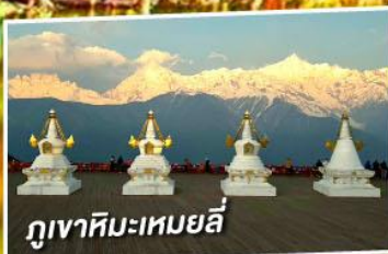
ภูเขาหิมะเหมยลี่