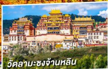
วัดลามะซงจ้านหลิน