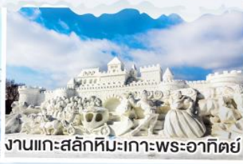
งานแกะสลักหิมะเกาะพระอาทิตย์