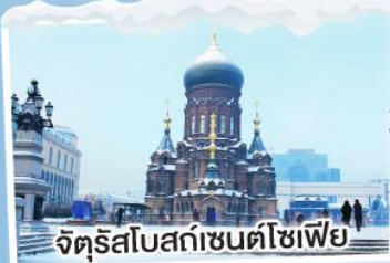
จัตุรัสโบสถ์เซนต์โซเฟีย