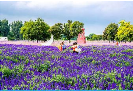
ทุ่งดอกลาเวนเดอร์

พักที่ HOLIDAY INN EXPRESS HTL OR ROYARD HTL 4* หรือโรงแรมในระดับเดียวกันในเมืองปักกิ่ง