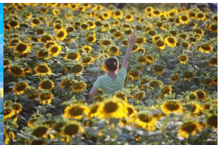
ดอกทานตะวันในสวนโอลิมปิก

วันที่สาม กรุงปักกิ่ง - กำแพงเมืองจีนด่านหวีงกวน – ศูนย์จำหน่ายหยก-สนามกีฬารังนก(ชมด้านนอก) - ชมดอกทานตะวันในสวนโอลิมปิก