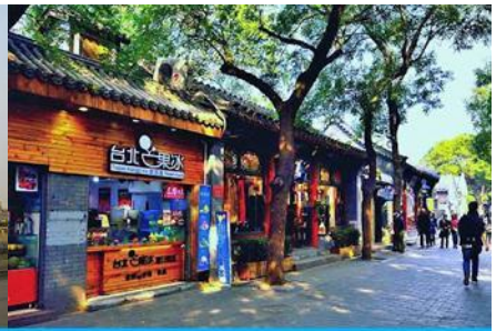
ซอยหนานหลวู่เซียง