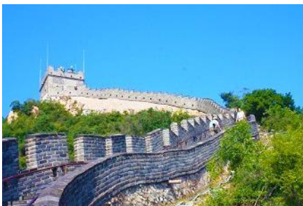
กำแพงเมืองจีนด่านหวีงกวน

ค่ำ อิสระอาหารค่ำ ให้ท่านมีเวลาเต็มที่ในการเดินเล่น และเปิดโอกาสให้ท่านได้ชิมลิ้มรสอาหารพื้นเมือง พักที่ HOLIDAY INN EXPRESS HTL OR ROYARD HTL 4* หรือโรงแรมในระดับเดียวกันในเมืองปักกิ่ง