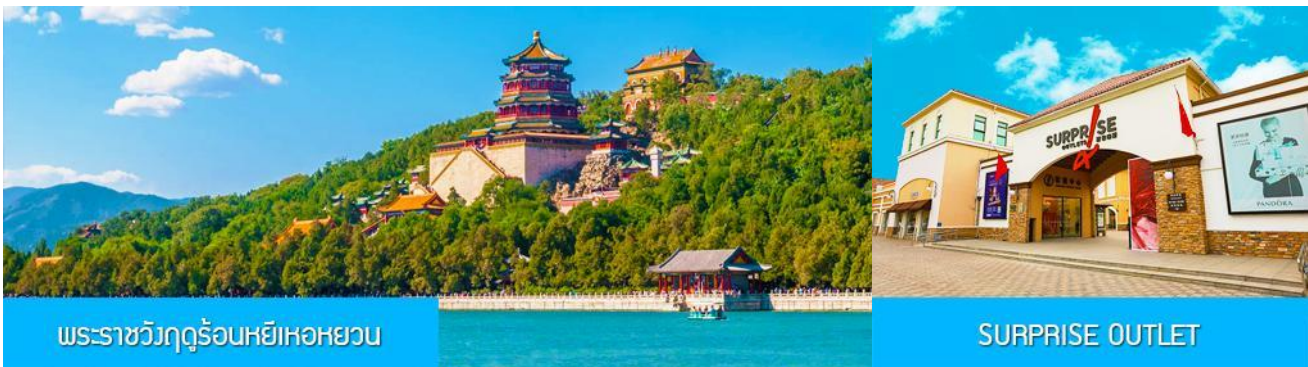
พระราชวังฤดูร้อนหยี่เหอหยวน

อิสระอาหารค่ำ ให้ท่านมีเวลาเต็มที่ในการเดินเล่น และเปิดโอกาสให้ท่านได้ชิมลิ้มรสอาหารพื้นเมือง พักที่ HOLIDAY INN EXPRESS HTL OR ROYARD HTL 4* หรือโรงแรมในระดับเดียวกัน ในเมืองปักกิ่ง