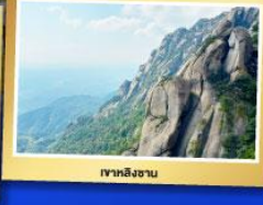
เขาวังหลิงซาน