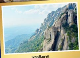
เทวหลิงซาน