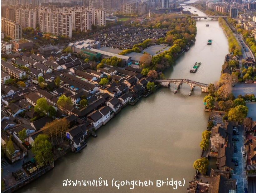
สะพานกงเฉิน (Gongchen Bridge)