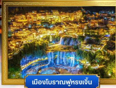
เมืองโบราณฟูหรงเจิน