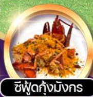
ซีฟู้ดกุ้งมังกร