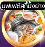
บุฟเฟต์สุกี้ปิ้งย่าง