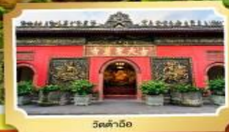
วัดต้าถื่อ