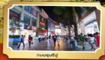
ถนนชุนชี่