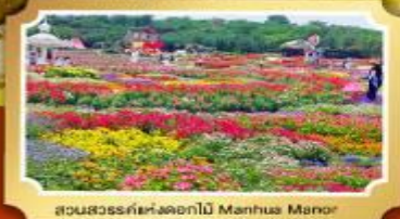
สวนสวรรค์แห่งดอกไม้ Manhua Manor