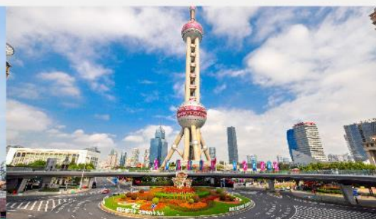
วงเวียนหมิงจู่