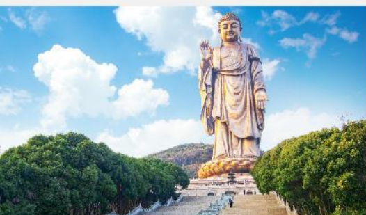
พระใหญ่หลิงซานต้าฝอ