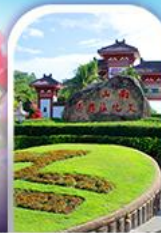
อุทยานหนานซาน