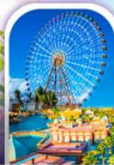
เมืองแฟนตาซี