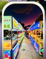
ตลาดอี่หิว