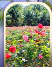
ทุ่งอ่าวยาหลวง