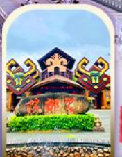
หมู่บ้านชนเผ่า