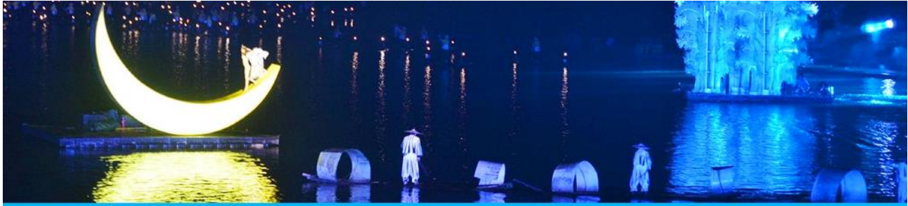
The Impression of Liu Shan Jie