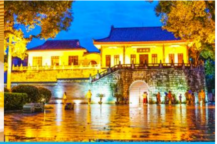
ประตูเมืองโบราณกุหนานเหมิน