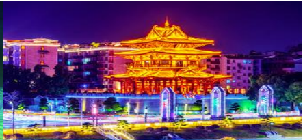
หอเชียวเหยาโหลว