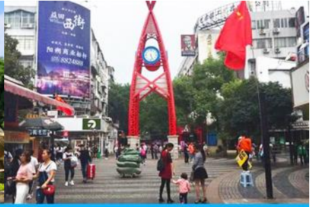
ถนนคนเดิน เจิ้งหยางลู่