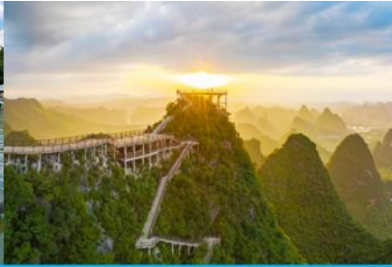
ภูเขาหฺรู่ฝิง