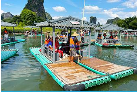
ชั้นเรือแพชมแม่น้ำหลีเจียง