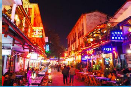
ถนนคนเดิน ซีเจียหรือถนนฝรั่ง

วันที่สอง เมืองกู่ยฺหลิน – ศูนย์จำหน่ายผลิตภัณฑ์หยก- เมืองหยางซั่ว – ล่องเรือแพแม่น้ำหลีเจียง- กระเช้าขึ้นเขาหฺรู่ฝิง – หยางซั่ว- ถนนฝรั่ง