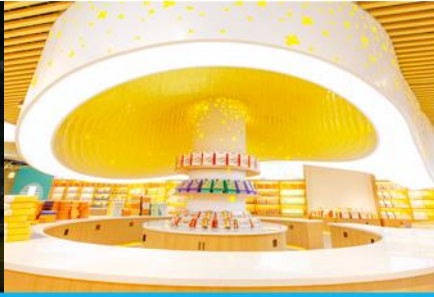
พิพิธภัณฑ์ดอกกุยฮวา