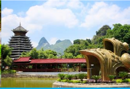
สวนหลิวซานเจีย