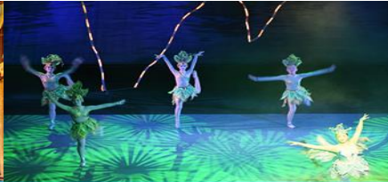
โชว์ DREAM LIKE LIJIANG