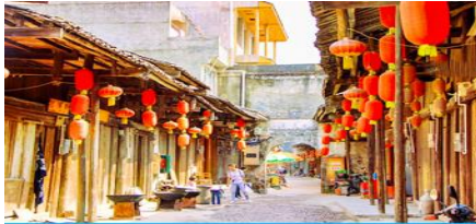
เมืองโบราณต้าชวี