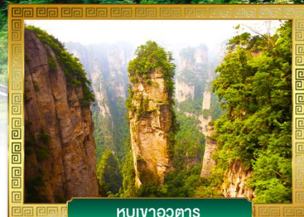
ภูเขาหวอดาร