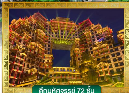
ตึกมหัศจรรย์ 72 ชั้น