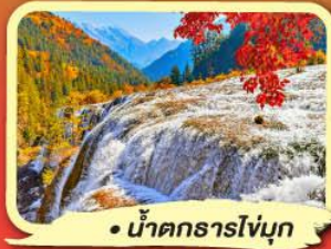
• น้ำตกธารโง่บูก

เดินทาง 11-16 ก.ย. 67 24,900.- 13-18 ก.ย. 67 25,900.-