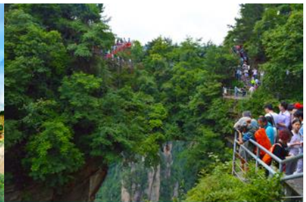
สะพานหนึ่งใบใต้หล้า

วันที่หก จางเจียเจี๋ย-จิ้น-ลงลิฟท์แก้วเที่ยวเขาเทียนจื่อซาน-ภูเขาอวตาร-สะพานหนึ่งใบใต้หล้า -ออฟชั่นะจก สะพานกรจกข้ามเขาแกรนด์แคนยอน