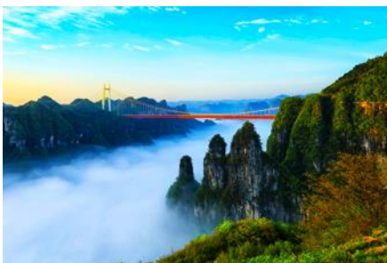
อุทยานป่าไม้แห่งชาติไฉ่จ้าย