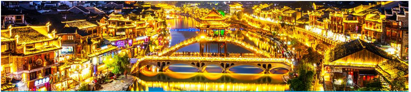
เมืองโบราณฟงหวง

จากนั้นนำท่านเดินทางสู่ เมืองโบราณฟงหวง (เมืองหงส์) 凤凰古城 ใช้เวลาเดินทางประมาณ 2 ชั่วโมง เมืองนี้ตั้งอยู่ในเขตปกครองตนเองของชนเผ่าตู่เจีย ตั้งอยู่ริมแม่น้ำฉางเจียงทางทิศตะวันตกของมณฑลหูหนาน ล้อมรอบด้วยขุนเขาเสมือนด่านช่องแคบภูเขาฟงหวง ตั้งเด่นตระหง่านเสมือนป้อมปราการ ชานน้ำฉางเจียงใสสะอาดราวน้ำบริสุทธิ์ที่ถูกกลั่นกรองจนมองเห็นก้นลำธาร ชุมชนที่เป็นบ้านเรือนจีนโบราณแบบยกพื้นสูงเรียงรายกันริมแม่น้ำ ช่างเป็นทัศนียภาพที่สวยงามมีเสน่ห์ของเมืองโบราณฟงหวง ราวกับดินแดนมนุษย์ที่สร้างอยู่บนสวรรค์.. *** นำท่านนั่งรถเมล์ของเมืองโบราณฟงหวงเข้าสู่โรงแรมในเมืองเก่า * กระเป๋าสัมภาระรวมค่าพนักงานขนจากรถบัสไปโรงแรมแล้ว