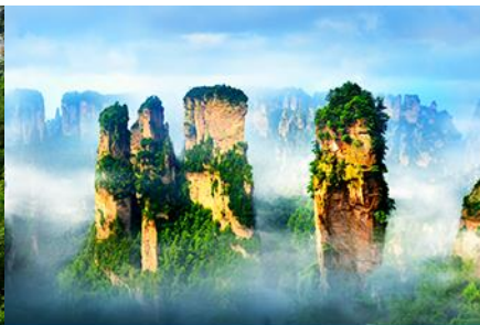
ภูเขาอวตาร