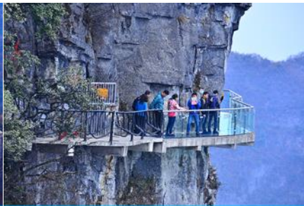
หน้าพลาวยฟ้าทาวเดินกระจก