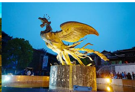
เมืองโบราณฟงหวง