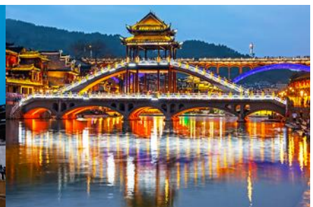
สะพานหงเจียว

วันที่สี่ ฝูหรงเจิ้น-เรือข้ามฝั่ง-อุทยานไฉ่จ้าย-เมืองโบราณฟงหวง จัตุรัสหงส์-สะพานหงเจียว-สะพานสายรุ้ง นอนในเมืองเก่า (รวมรถขนกระเป๋าเข้าโรงแรม)