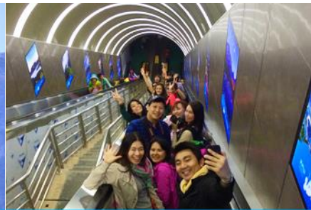
บันไดเลื่อนทะลุภูเขา