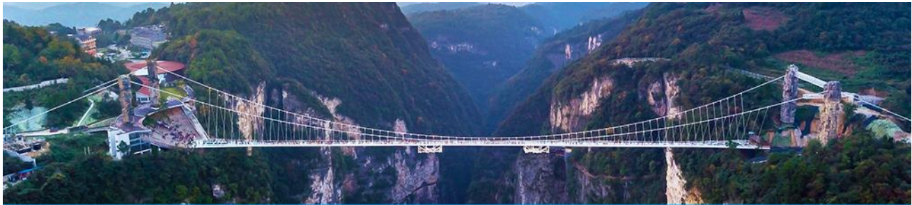
สะพานกระจกข้ามหุบเขาแกรนด์แคนยอน

หลังอาหารให้ท่านพักผ่อนตามอัธยาศัย หรือ ท่านสามารถเลือกซื้อ โปรแกรมเสริมซึ่งเป็น โปรแกรมท่องเที่ยวที่ไม่ได้รวมอยู่ในรายการท่องเที่ยว ได้แก่ โปรแกรมเที่ยวสะพานกระจกที่ถูกสร้างล้อมหุบเขาที่สูงที่สุดในโลก สะพานกระจกจางเจียเจีย (张家界大峡谷玻璃桥) ในเขตอุทยานแกรนด์แคนยอน ทำทนายท่านด้วยการเดินผ่าน สะพานพื้นกระจกใสที่มีความสูงจากพื้น 980 ฟุต โดยมีความยาวของสะพาน 400 เมตร สะพานที่น่าหวาดเสียวแห่งนี้ออกแบบ โดย Haim Dotan วิศวกรชาวอิสราเอล โดยต้องการสร้างสะพานกระจกเพื่อเชื่อมยอดเขาสองยอดเข้าไว้ด้วยกัน สามารถรองรับนักท่องเที่ยวได้คราวละ 800 คนพร้อมกัน สะพานนี้เป็นอีกหนึ่งไฮไลท์สำหรับผู้มาเยือนจางเจียเจีย