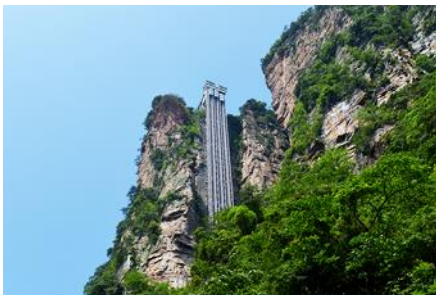
ลิฟท์แก้วไปหลาง

หลังอาหารนำท่านเดินทางเข้าที่พัก หรือท่านสามารถเลือกซื้อโปรแกรมเสริม เป็นบัตรชมการแสดง ชุด The Love Story of a Wooden man and Fairy fox หรือที่เรียกกันในหมู่นักท่องเที่ยวไทยว่า โข่วจิ้งจอกขาว เป็นการแสดงกลางแจ้งที่ทุ่มทุนสร้างอย่างสุดอลังการ เป็นการแสดงที่น่าดูชมที่สุดในเมืองจางเจียเจี๋ย การแสดงชุดนี้ใช้ภูเขาประติมากรรมเป็นฉากหลังประกอบการแสดง ซึ่งให้ความรู้สึกสมจริงเสมือนผู้ชมและนักแสดงอยู่ท่ามกลางธรรมชาติ ใช้ทีมงานนักแสดงหลายร้อยคน และระบบแสง สี เสียงที่ทันสมัยประกอบการแสดง อัตราค่าบริการสำหรับโปรแกรมเสริมการแสดงชุด The love Story of Wooden man and Fairy Fox ท่านละ 400 หยวน (หรือ 2,000 บาทขึ้นอยู่กับอัตราแลกเปลี่ยน) ระยะเวลาที่ใช้ในการเที่ยวชมการแสดง ประมาณ 3 ชั่วโมง รวมเวลาเดินทางไป กลับค่าบริการรวม ค่าบัตรเข้าชม ค่ารถรับ ส่ง และค่าน้ำดื่มของไกด์ท้องถิ่น พักที่ ZHENMIAN HOTEL โรงแรมระดับ 4 ดาวหรือเทียบเท่าจางเจียเจี๋ย