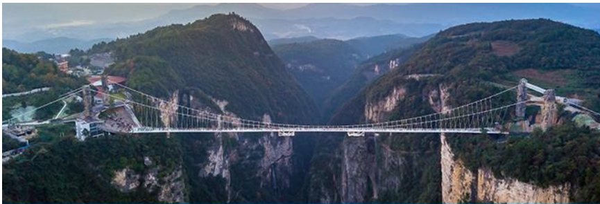
สะพานกระจกจางเจียเจี๋ย