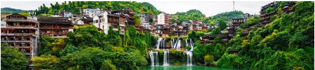
เมืองโบราณผู่หรงเจิ้น

วันแรก ทำอากาศยานสุวรรณภูมิ – เมืองจางเจียเจี๋ย – เมืองโบราณผู่หรงเจิ้น นอนผู่หรงเจี๋ย