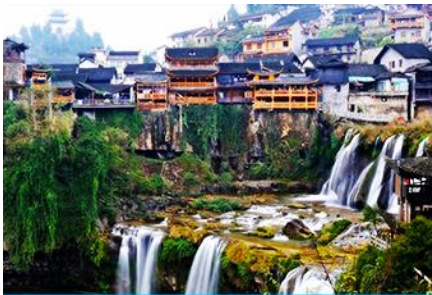
เมืองโบราณฝูหรงเจิ้น

พักที่ FURONGZHEN CHAXITAI HOTEL โรงแรมระดับ 4 ดาวหรือเทียบเท่าในเมืองโบราณฝูหรงเจิ้น