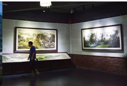
พิพิธภัณฑภาพหินทราย

วันที่ห้า อุทยานหวู่หลิงหยวน - เลือกซื้อโปรแกรมทัวร์เสริม(สะพานกระจกข้ามหุบเขาแกรนด์แคนยอน) – พิพิธภัณฑภาพหินทราย - เดินทางกลับกรุงเทพฯ