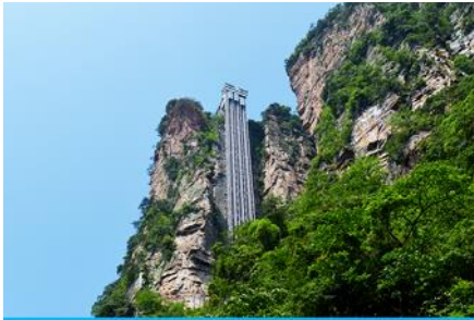
ลิฟท์แก้วไปหลง

พักที่ โรงแรม MELLON CRYSTAL HOTEL ระดับ 4 ดาวท้องถิ่นหรือเทียบเท่าใน เมืองจางเจี๋ยเจี๋ย