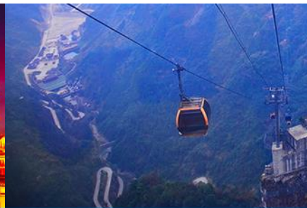
กระเช้าขึ้นเทียนเหมินซาน