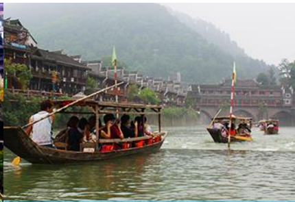
ล่องเรือแม่น้ำถั่วเจียง