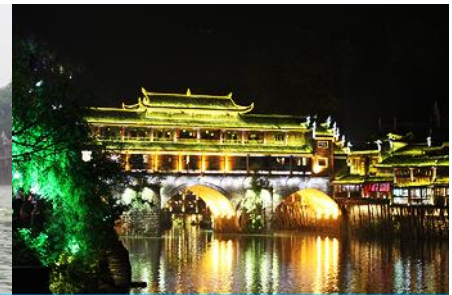
เมืองโบราณฝ่งหวง

วันที่สอง เที่ยวชมเมืองโบราณฝูหรงเจิ้น- เมืองโบราณฝ่งหวง - ล่องเรือแม่น้ำถั่วเจียง - เที่ยวชมเมืองโบราณฝ่งหวง นอนฝ่งหวง