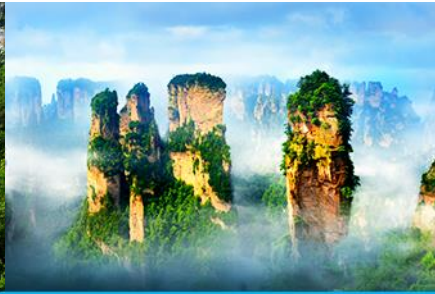
ภูเขาอวตาร