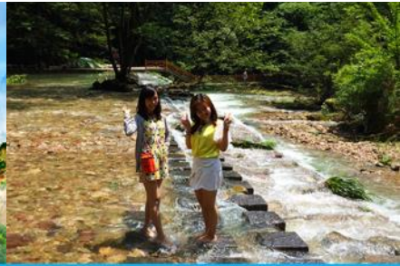
ลำธารจินเปียนซี