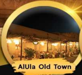
AlUla Old Town