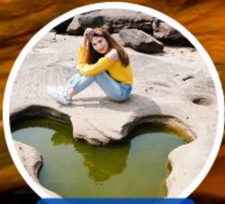
สามพันโบก