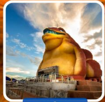
พญาคันคาก