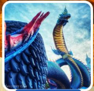
พญาศรีมุกดา