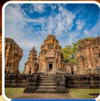
ปราสาทศรีขรภูมิ