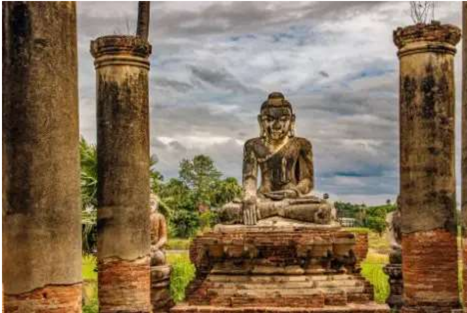
นำท่านสู่ วัดมหาอ่องเหม่ บอนซาน (Maha Aung Myay Bone San) หรือ วัดเมห์นู อ็อกคยั้ง (Mae Nu Oak Kyaung Temple) เป็นวัดที่พระราชินีเมห์นู พระมเหสีของพระเจ้าบาจิดอ หรือ พระเจ้าจ๊กกายแมง กษัตริย์อั้งวะ สร้างให้เจ้าอวาสวัต เมื่อ ค.ศ. 1822