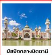
มิสยิดกลางปัตตานี