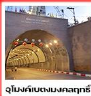
อุโมงค์เบตงมงคลฤทธิ์

ศาลเจ้าแม่ลิ้มกอเหนี่ยว • วัดพรวัดช้างให้ • สะพานข้ามอ่างเก็บน้ำเขื่อนบางลาง สะพานแตปูซ • บ่อน้ำร้อนเบตง • ป้าย OK BETONG • ตู้ไปรษณีย์ • สตรีทอาร์ตเบตง