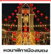
หอนาฬิกาเมืองเบตง