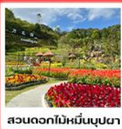
สวนดอกไม้หะยีหมื่นบุษยามา