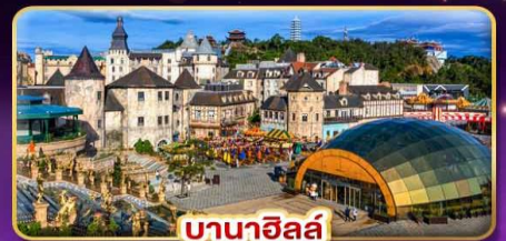
บานาฮิลล์