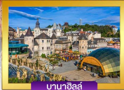
บานาฮิลล์