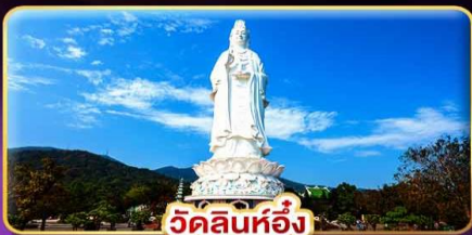
วัดลินห์ฮื่อง

เทศกาลดอกไม้ไฟนานาชาติดานัง พิเศษ!! รวมบัตรที่นั่งชมบนสแตนดัดเทศกาลพลุ