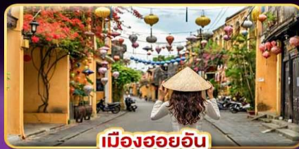
เมืองฮอยอัน