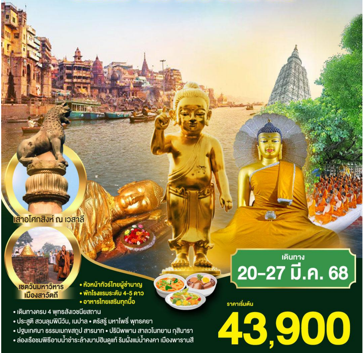
เสาอโศกสิงห์ ณ เวสาลี