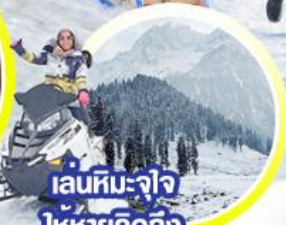
เล่นหิมะ-จ้ำจี้ ให้หายคิดถึง