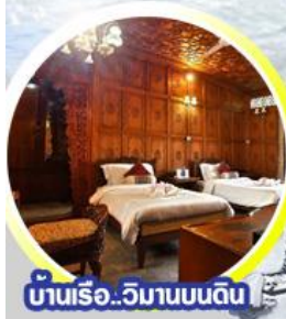
บ้านเรือ..วิมานบนดิน