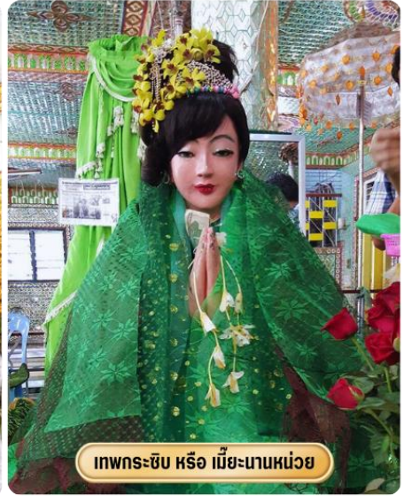
เทพกระซิบ หรือ เมื่อยะนานหน่วย

เที่ยง ๑๑ รับประทานอาหารกลางวัน ณ ร้านอาหาร (ชาบูพรีเมียม)