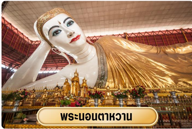
พระนอนตาหวาน

นำท่านนมัสการ พระนอนตาหวาน วัดเจาทัดลี พระพุทธรูปไสยาสน์เจาทัดยี หรือพระตาหวาน เป็นพระนอนปางพุทธไสยาสน์องค์ใหญ่ มีความยาวกว่า 70 เมตร เป็นพระนอนที่ใหญ่ที่สุดและมีความงดงามที่สุดของประเทศพม่า ทั้งพระพักตร์และขนตาที่งดงาม ดวงตาของท่านเป็นแก้ว สั่งผลิตมาจากต่างประเทศ โดยเฉพาะรวมไปถึงพระจีวรที่มีความพลิ้วไหวสมจริงและเมื่อเดินมายังปลายสุดพระบาทของพระนอนองค์นี้ ตรงที่พระบาทมีภาพวาดเป็นมิ่งมงคลสูงสุด เพราะประกอบด้วยลายลักษณะธรรมจักร ในบริเวณใจกลางฝ่าพระบาทและล้อมด้วย รูปมงคล 108 ประการ