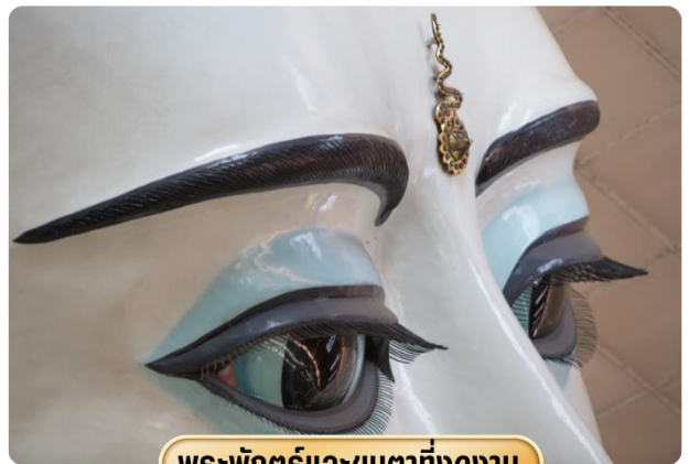
พระพักตร์และขนตาที่งดงาม

จากนั้นนำท่านสู่ วัดพระเจดีย์พระเจ้ากัทยี นำท่านนมัสการพระประธานในวัด ซึ่งเป็นพระพุทธรูปนั่งปางมารวิชัยสีขาว ทรงเครื่องแบบพม่า มีขนาดสูงใหญ่มากๆ ประดิษฐานอยู่ในวิหารที่มองจากด้านนอกจะเห็นหลังคาข้างบนคล้ายเจดีย์ทรงสี่เหลี่ยมขาวพม่าศรัทธา พระพุทธรูปองค์นี้อย่างมาก ในแต่ละวันจะเห็นคนมานั่ง ทำสมาธิด้านหน้าองค์พระ คนที่มา ที่วัดนี้ส่วนมากจะเป็นชาวพม่าหรือชาวไทยใหญ่ และคนที่เดินทางมาจากรัฐฉาน วัดพระเจดีย์พระเจ้ากัทยี เวลาออกเสียงจะได้ยินชาวพม่าออกเสียงเร็วๆ คล้ายๆ คำว่างาทะเล