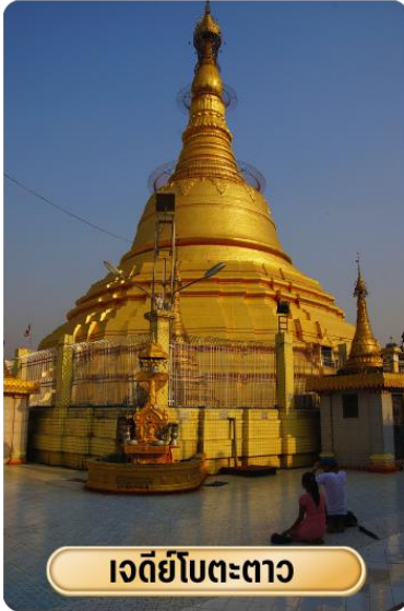
เจดีย์โบตตะดาว

เช้า ๑๐ รับประทานอาหารเช้า ณ ห้องอาหารโรงแรม นำท่าน เจดีย์โบตตะดาว หมายถึง "ทหาร1,000นาย" เจดีย์แห่งนี้เคยบรรจุพระเกศาธาตุของพระพุทธเจ้า ก่อนที่จะเชิญ ประดิษฐาน ณ เจดีย์ชเวดากอง ซึ่งถูกค้นพบ จากการที่ถูกระเบิดของฝ่ายสัมพันธมิตรลงกลางเจดีย์ ซึ่งภายในเจดีย์แห่งนี้ สวยงามตกแต่งด้วยสีทองอร่าม ประดิษฐานพระพุทธรูปทองคำ ปางมารวิชัยที่สวยงาม ซึ่งจุดเด่นที่ทำให้วัดแห่งนี้เป็นที่ รู้จักอย่างกว้างขวางคือ "รูปปั้นเทพทันใจ" หรือ นัตโบโบยี เป็นที่สักการะยอดนิยม และเป็นที่น่าเชื่อถืออย่างมากของชาว มอญ และพม่าในย่างกุ้ง เชื่อว่าหากอธิษฐานขอพรสิ่งใดแล้วจะได้ตามขอ สมปรารถนาทันใจเลยทีเดียว สมควรแก่เวลาน่า ท่านขอพรจาก "เทพกระซิบ" หรือ เมื่อยะนานหน่วย ประทับอยู่ฝั่งตรงข้ามกับเจดีย์โบตตะดาว เทพกระซิบเป็นธิดาของ พญานาคที่มีความศรัทธาต่อพระพุทธศาสนา เชื่อกันว่าถ้ากระซิบขออะไรแล้วจะสมหวัง