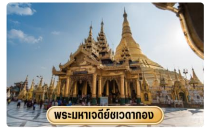
พระมหาเจดีย์ชเวดากอง