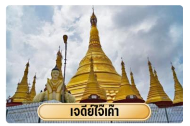
เจดีย์ไจ้เค้า

จากนั้นนำท่านสู่ วัดสินธุพิราค์ส เป็นวัดสินธุที่มีอายุมากกว่า 160 ปี ซึ่งเป็นวัดที่มีอายุเก่าแก่ของชาวอินเดียนที่นับถือศาสนาฮินดู สร้างขึ้นเมื่อประมาณปี ค.ศ.1861 โดยชาวอินเดียนที่นับถือศาสนาฮินดูบริเวณนี้ ซึ่งเป็นชาวอินเดียนที่ถูกตอนเข้ามาสมัยอังกฤษปกครองเมียนมา จากนั้นนำท่านนมัสการ พระมหาเจดีย์ชเวดากอง เจดีย์ทองแห่งเมืองดากอง หรือ ตะเกิง (ชื่อเดิมของเมืองย่างกุ้ง) แห่งลุ่มน้ำอิรวดี เจดีย์ทองคำคู่บ้านคูเมืองประเทศพม่าอายุกว่าสองพันห้าร้อยกว่าปี มหาเจดีย์ที่ใหญ่ที่สุดของประเทศพม่า มีความสูงถึง 326 ฟุต สร้างโดยพระเจ้าโอะกะลาปะ เมื่อกว่า 2,000 ปีก่อน มหาเจดีย์ชเวดากองมีทองคำโอบหุ้มอยู่เป็นน้ำหนักถึง 1100 กิโลกรัม ยอดฉัตรประดับประดาด้วยเพชรพลอยอัญมณีล้ำค่า กว่า 5,548 เม็ด รวมถึงทับทิมขนาดเท่าไข่ไก่บนยอดองค์พระเจดีย์ชเวดากองเป็นลานกว้างรองรับแรงศรัทธาของ