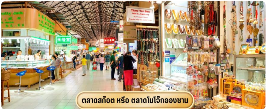
ตลาดสก๊อต หรือ ตลาดโบโจ๊กองซาน