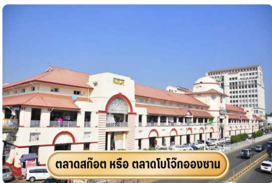
ตลาดสก๊อต หรือ ตลาดโบโจ๊กองซาน

จากนั้นนำท่านช้อปปิ้ง สินค้าของฝากที่ ตลาดสก๊อต หรือเรียกอีกอย่างว่า ตลาดโบ-ยก อองซาน เป็นตลาดสำคัญของเมืองย่างกุ้ง โดยของขึ้นชื่อที่ตลาดแห่งนี้คือ "หยกพม่า" ซึ่งได้รับความนิยมจากนักท่องเที่ยวเป็นอย่างมาก นอกจากนี้ยังถือเป็นตลาดที่มีสินค้าหลากหลายชนิดให้เลือกซื้อ ทั้งข้าวของเครื่องใช้ ของฝากของที่ระลึก เสื้อผ้า ไปจนถึงอาหาร