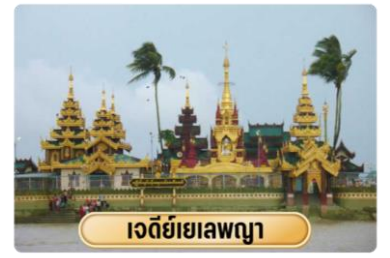
เจดีย์เยเลพญา

๑๐ รับประทานอาหารกลางวัน ณ ร้านอาหาร นำท่านเดินทางสู่ เจดีย์เยเลพญา หรือ เจดีย์กลางน้ำ ตามตำนานเล่าว่า เจดีย์แห่งนี้สร้างในสมัยมอญเรืองอำนาจ เมื่อราวพันกว่าปีก่อน โดยมีคหบดีชาวมอญเป็นผู้สร้างและยังได้ตั้งจิตอธิษฐานว่า ถ้าน้ำท่วมก็ขออย่าให้ท่วมองค์พระเจดีย์ ถ้ามีผู้คนมากราบไหว้จำนวนมากเท่าไรก็ขอให้ไม่มีวันเต็มสันพื้นที่ เพราะเจดีย์แห่งนี้สร้างบนเกาะมีสภาพเป็นเพียงเกาะเล็ก ๆ กลางแม่น้ำกว้างใหญ่เท่านั้น และเจดีย์แห่งนี้ขึ้นชื่อในเรื่อง ไหว้พระขอพรทำธุรกิจทางการค้า จากนั้นเดินทางไปยัง เจดีย์ไจ้เค้า เป็นเจดีย์เก่าแก่ อีกแห่งหนึ่ง และเป็นเจดีย์คู่บ้านคูเมืองสิริเรียม สร้างโดยกษัตริย์รัฐมอญที่เมืองสะเทิม มาสร้างเจดีย์ที่เนินเขาชื่อว่าไลโปะกง โดยเนินเขาแห่งนี้มีถ้ำอยู่ต้นหนึ่งชื่อว่า คอลากะ หรือ เคาะละ อาศัยปกปักรักษาอยู่บริเวณเนินเขา เดิมเจดีย์แห่งนี้มีชื่อตามภาษามอญว่าไจ้เคาะละ ต่อมาเพี้ยนเป็นภาษาเมียนมาร์ว่า ไจ้เค้า โดยวัดแห่งนี้ภายในเจดีย์ไจ้เค้าจะมีสิ่งศักดิ์สิทธิ์ที่ผู้คนนิยมเข้าไปกราบไหว้บูชา นั่นก็คือพระเกศาของพระพุทธเจ้า 6 เส้นที่บรรจุอยู่ด้านในขององค์เจดีย์ ส่วนใหญ่จะมากกราบไหว้เพื่อความ เป็นสิริมงคล หากใครที่อยากจะมาขอพรนั้น จะต้องมากกราบขอพระกับองค์เทพทันใจที่อยู่ในบริเวณเดียวกัน ซึ่งมีชื่อชื่อว่า "ตันลยินไจ้เค้าโบโบจี"