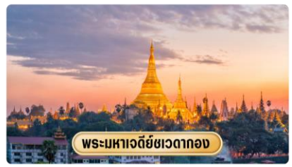
พระมหาเจดีย์ชเวดากอง

พุทธศาสนิกชนได้จำนวนมาก บริเวณทางขึ้นทั้งสี่ทิศจะมีวิหารโถงสร้างด้วยเครื่องไม้หลังคาทรงปราสาทปิดทองล่องชาดประดับกระจกทั้งหลัง ภายในประดิษฐานพระประธานสำหรับให้ประชาชนมากราบไหว้บูชา เพราะชาวมอญและชาวพม่าถือการกราบไหว้บูชาเจดีย์ชเวดากองเป็นนิตย์ จะนำมาซึ่งบุญกุศลอันเป็นหนทางสู่การหลุดพ้นทุกข์โศกโรคภัยทั้งมวล บ้างนั่งทำสมาธิเจริญสติภาวนานับลูกประคำ และบ้างเดินประทักษิณรอบองค์เจดีย์ จากนั้นให้ท่านชมแสงของอัญมณีที่ประดับบนยอดฉัตรโดยจุดชมแต่ละจุดท่านจะได้เห็นแสงสีต่างกันออกไป เช่น สีเหลือง, สีน้ำเงิน, สีส้ม, สีแดง เป็นต้น สถานที่สำคัญ ของพระมหาเจดีย์ชเวดากอง คือ ลานอธิฐาน จุดที่บเรณองมาขอพรก่อน ออกรบ ท่านสามารถนำดอกไม้ธูปเทียน ไปไหว้ เพื่อขอพรจากองค์ เจดีย์ชเวดากอง ณ ลานอธิฐานเพื่อเสริมสร้างบารมีและสิริมงคล นอกจากนี้รอบองค์เจดีย์ยังมีพระประจำวันเกิดประดิษฐานทั้งแปดทิศรวม 8 องค์ หากใครเกิดวันไหนก็ให้ไปสรงน้ำพระประจำวันเกิดตน จะเป็นสิริมงคลแก่ชีวิต