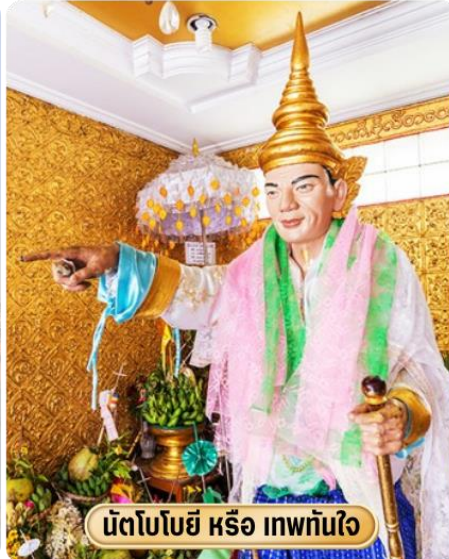
นัตโบโบยี หรือ เทพทันใจ