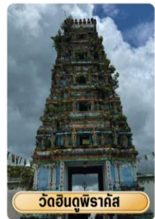
วัดสินธุพิราค์ส

จากนั้นนำท่านสู่ วัดสินธุพิราค์ส เป็นวัดสินธุที่มีอายุมากกว่า 160 ปี ซึ่งเป็นวัดที่มีอายุเก่าแก่ของชาวอินเดียนที่นับถือศาสนาฮินดู สร้างขึ้นเมื่อประมาณปี ค.ศ.1861 โดยชาวอินเดียนที่นับถือศาสนาฮินดูบริเวณนี้ ซึ่งเป็นชาวอินเดียนที่ถูกตอนเข้ามาสมัยอังกฤษปกครองเมียนมา จากนั้นนำท่านนมัสการ พระมหาเจดีย์ชเวดากอง เจดีย์ทองแห่งเมืองดากอง หรือ ตะเกิง (ชื่อเดิมของเมืองย่างกุ้ง) แห่งลุ่มน้ำอิรวดี เจดีย์ทองคำคู่บ้านคูเมืองประเทศพม่าอายุกว่าสองพันห้าร้อยกว่าปี มหาเจดีย์ที่ใหญ่ที่สุดของประเทศพม่า มีความสูงถึง 326 ฟุต สร้างโดยพระเจ้าโอะกะลาปะ เมื่อกว่า 2,000 ปีก่อน มหาเจดีย์ชเวดากองมีทองคำโอบหุ้มอยู่เป็นน้ำหนักถึง 1100 กิโลกรัม ยอดฉัตรประดับประดาด้วยเพชรพลอยอัญมณีล้ำค่า กว่า 5,548 เม็ด รวมถึงทับทิมขนาดเท่าไข่ไก่บนยอดองค์พระเจดีย์ชเวดากองเป็นลานกว้างรองรับแรงศรัทธาของ