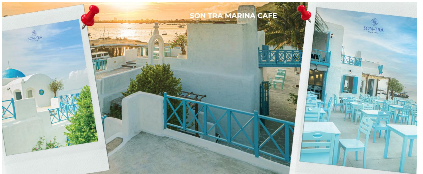
(ไม่รวมค่าเครื่องดื่ม+อาหาร)

09.05 น. เดินทางถึงสนามบิน Danang International Airport (สนามบินเมือง ดานัง) นำท่านผ่านด่านตรวจคนเข้าเมือง และศุลกากร นำท่านขึ้นรถโค้ชปรับอากาศ จากนั้นนำท่านเดินทางเข้าสู่คาเฟ่ริมทะเล ที่ SON TRA MARINA CAFE คาเฟ่ริมทะเลที่ตกแต่งสไตล์ ซานโตรินี ที่สอดคล้องกับบรรยากาศสบายๆ ริมทะเล ซึ่งเป็นจุดที่เป็นท่าเรือยอร์ช จึงทำให้คาเฟ่แห่งนี้ ได้ขึ้นชื่อว่า ซานโตรินีแห่งเวียดนาม ด้วยการตกแต่งสถานที่ด้วยสีขาวยและสีฟ้าอ่อน และที่สำคัญทั้งเมนูเครื่องดื่มและเบเกอรี่ที่หลากหลาย จึงทำให้คาเฟ่แห่งนี้ เป็นที่นิยมของนักท่องเที่ยวทั้งชาวต่างชาติ และชาวเวียดนามเองก็ตาม