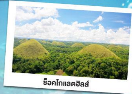
ซ็อคโกแลตฮิลล์