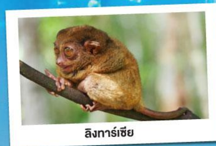
ลิงทาร์เซียร์