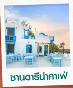
ซานตารีน้ำกาแฟ