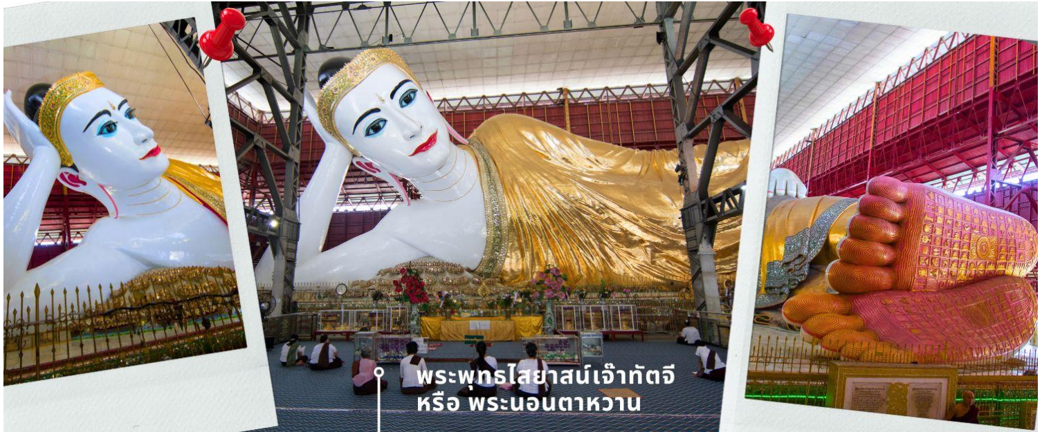
พระพุทธรูปไสยาสน์เจ้ากัตจี หรือ พระนอนตาหวาน

นำท่านสักการะ พระพุทธไสยาสน์เจ้ากัตจี หรือ พระนอนตาหวาน ซึ่งเป็นพระพุทธรูปสลายนองค์ขนาดใหญ่ที่มีความสูงถึง 6 ชั้น ยาวกว่า 70 เมตร ใช้โครงเหล็กกันถึง 65 เมตร มีหลังคาคลุม 6 ชั้น สร้างขึ้นเมื่อปี 1907 ถูกยกย่องให้เป็นพระนอนที่ใหญ่และงดงามที่สุดในพม่า ด้วยพระพักตร์ที่งดงามเปื้อนยิ้ม ดวงตาทำจากลูกแก้วที่สั่งผลิตจากต่างประเทศ ทาขอบตาด้วยสีฟ้าและมีขนตาหนายาวทำให้ดวงตาดูหวาน จนถูกเรียกพระนามอีกชื่อคือ “พระตาหวาน” บริเวณพระบาทมีภาพวาดลายธรรมจักร ตรงกลางฝ่าพระบาทล้อมรอบด้วยรูปมงคล 108 ประการ ที่แสดงถึงอากาศโลก สัตว์โลก และสังขารโลก อีกทั้งจิวยังมีลักษณะพริ้วไหวสมจริงและตรงชาย