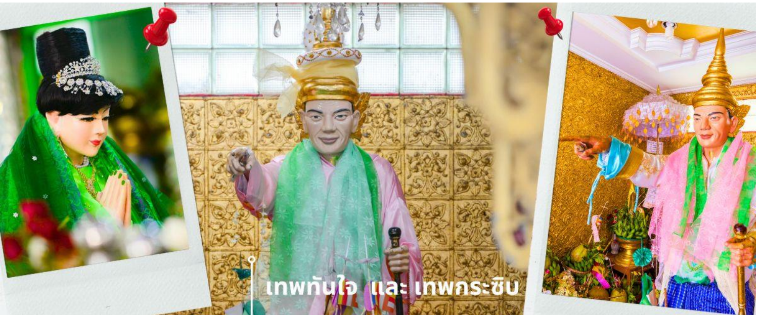
เทพทันใจ และ เทพกระซิบ

เจดีย์โบตาทาว (Botahtaung Pagoda) หมายถึง ทหาร 1,000 นาย เมื่อในอดีตพระเจ้าโองกะลาปะกษัตริย์มอญ ได้ให้ทหาร 1,000 นาย ตั้งแถวถวายความเคารพพระเกศาธาตุ บรรจุไว้ 1 เส้น ในเจดีย์นี้ ที่อันเชิญมาจากอินเดีย ไฮไลท์ที่สำคัญที่นักท่องเที่ยวนิยมมาสถานที่แห่งนี้คือ การมาสักการะบูชา เทพทันใจ หรือ นัตโบโบยี และยังมี เทพกระซิบ ภายในเจดีย์เป็นที่เก็บผอบหินทรงสถูปพบสมบัติล้ำค่าหลายชนิดเช่น อัญมณี, เครื่องประดับ, เพชรพลอย, จาริกดินเผา, และพระพุทธรูปทองคำ, เงิน, ทองเหลือง, หิน พระพุทธรูปจำนวนทั้งหมดภายในและภายนอกพบราวกว่า 700 องค์ จาริกดินเผาบางส่วนเป็นเรื่องราวของคำสอนและเรื่องราวทางพุทธศาสนาของนัตโบโบยี หรือ คนไทยรู้จักกันในชื่อว่า เทพทันใจ เป็นคำเรียกเทพเจ้านัต ที่เป็นเทพารักษ์ประจำวัดหรือพระเจดีย์ในศาสนาพุทธแบบพม่า โดยทั่วไปนิยมสร้างรูปเคารพโบโบยี เป็นรูปเคารพชายสูงวัยขนาดเท่าบุคคล สวมเครื่องประดับศิระ บางครั้งถือไม้เท้าเพื่อย้ำถึงความอาวุโส เทพทันใจแห่งนี้ เป็นสถานที่ที่คนไทยให้ความนับถือเป็นอย่างมาก เชื่อกันว่าการได้มาขอพรกับ นัตโบโบยี จะสัมฤทธิ์ผล