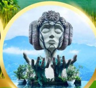
โมอาน่า ซาปา คาเฟ่