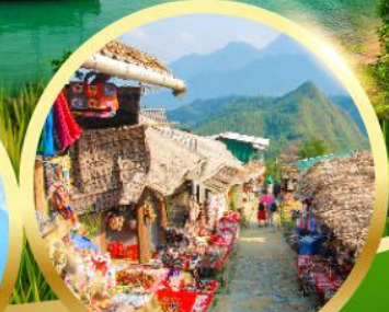
หมู่บ้านก๊ตก๊ต