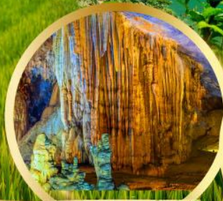
ถ้ำสวรรค์