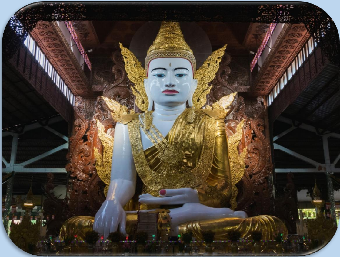
สมควรแก่ เวลานำท่าน

เดินทางสู่ สนามบินย่างกุ้ง เพื่อเดินทางกลับสู่ประเทศไทย