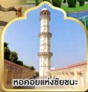
หอคอยแห่งชัยชนะ