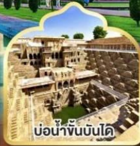
บ่อน้ำพันบันได