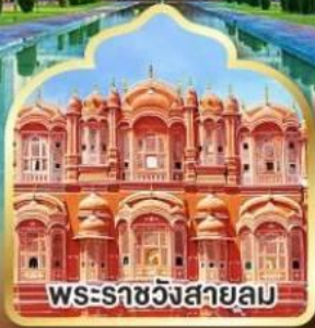
พระราชวังสายลม