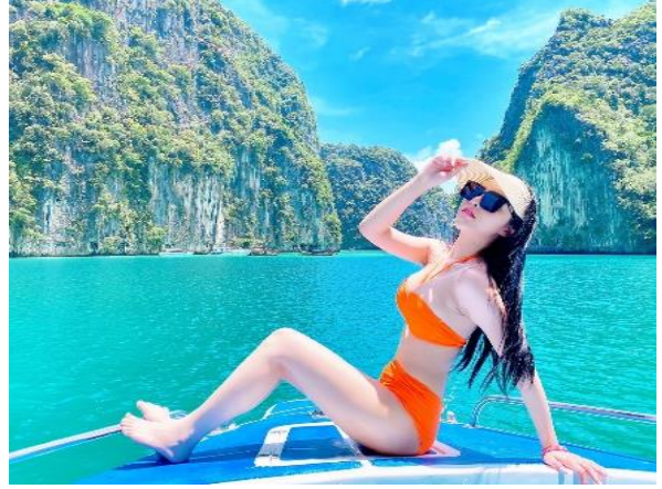
ลงเล่นน้ำดำสนับตเกิล ชม ดอกไม้ทะเล และฝูงปลาการ์ตูน หน้า ถ้ำไวกิ้ง