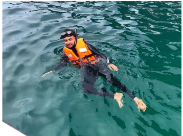
ออกเดินทางไปยังเกาะพีพีดอน