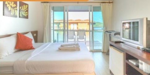
Island Room ( บ้านแพะ )