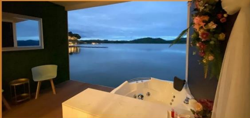
Jacuzzi Deluxe Room ( บ้านแพะ )