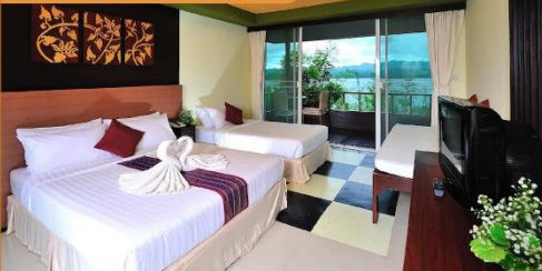
Hillside Deluxe Room