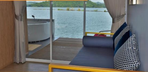
Jacuzzi Suite ( บ้านแพะ )