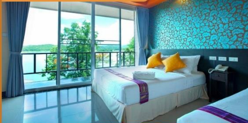
Hillside Superior Room