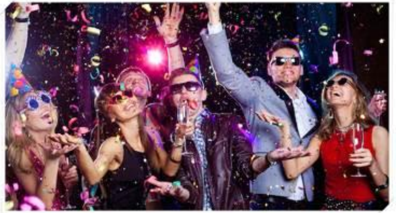
ENJOY THE NIGHT OF FANTASTIC PERFORMANCE