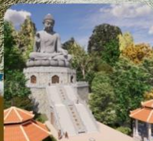
วัดถ้ำเขาชะอางค์