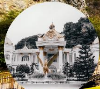
อลังการ เคียงผาคาเฟ่