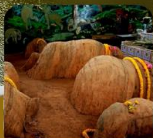
เทพช้างทัพศิลา